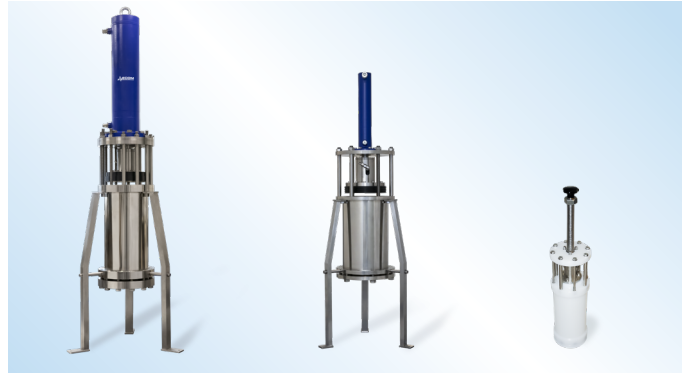
Cột sắc ký hiệu năng cao PC01 với cơ chế nén trực